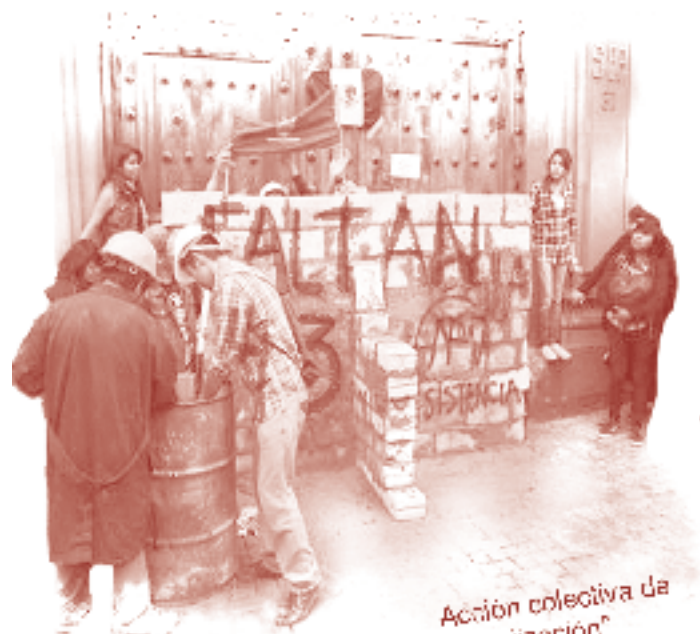
Acción colectiva de "desinstitucionalización"

Estudiantes del Instituto Politécnico Nacional construyen un muro clausurando la entrada a la sede de la Secretaría de Educación Pública, en protesta por la designación unilateral del nuevo director general para este instituto y exigen la resolución de todo su plantel peticionario