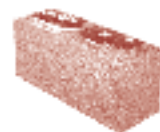
Clausurar un edificio institucional

Estudiantes del Instituto Politécnico Nacional construyen un muro clausurando la entrada a la sede de la Secretaría de Educación Pública, en protesta por la designación unilateral del nuevo director general para este instituto y exigen la resolución de todo su plantel peticionario